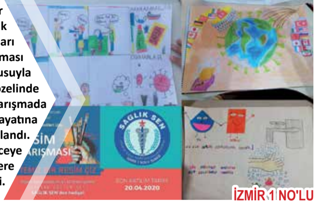
İZMİR 1 NO'LU

Sağlık-Sen İzmir 1 No'lu Şubesi, sağlık çalışanlarının çocukları için resim yarışması düzenledi. Hijyen konusuyla ilkököl çocukları özelinde düzenlenen yarışmada çocukların eğitim hayatına katkı sunulması amaçlandı. Yarışma sonunda dereceye giren öğrencilere hediyeler verildi.