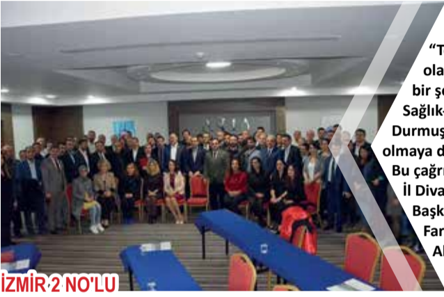
İZMİR 2 NO'LU