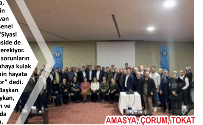
AMASYA, ÇORUM, TOKAT